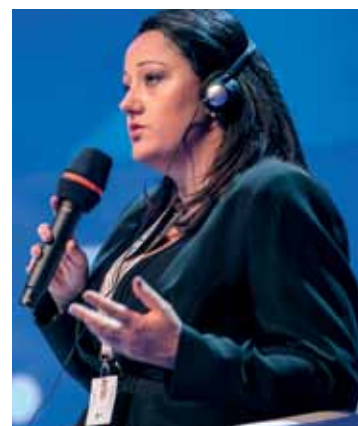
Lilyana Pavlova , Minister, Ministerstwo Rozwoju Regionalnego, Bułgaria